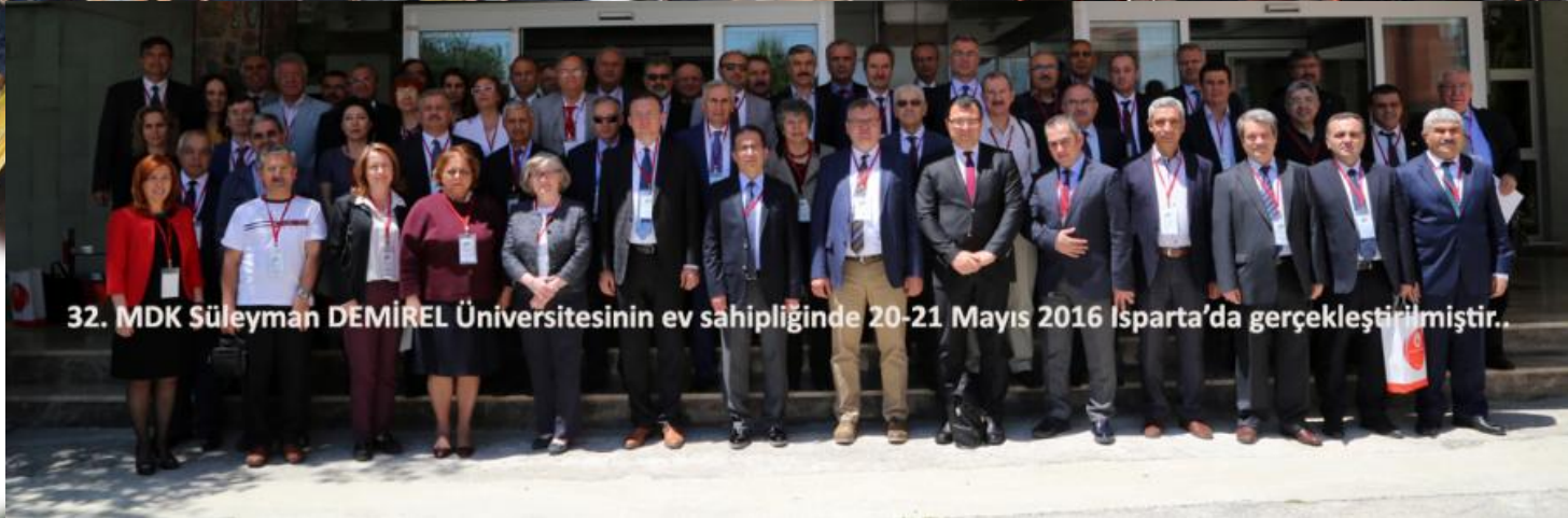
32. MDK Süleyman DEMİREL Üniversitesinin ev sahipliğinde 20-21 Mayıs 2016 Isparta'da gerçekleştirilmiştir.